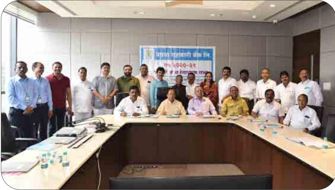
बँकेच्या ४८ व्या ऑनलाईन वार्षिक सर्वसाधारण सभेप्रसंगी उपस्थित सर्व मा.संचालक मंडळ