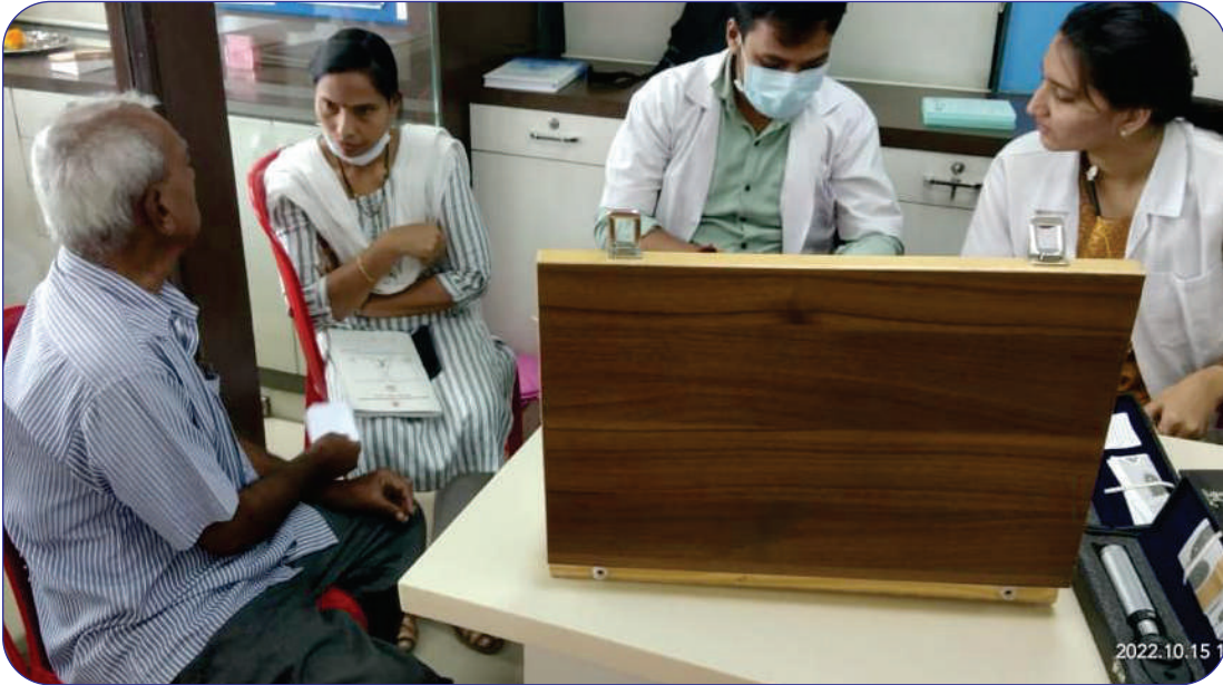
बँकेच्या स्पार्इन रोड शाखेच्या वर्धापन दिनी ग्राहकांसाठी आरोग्य शिबीर आयोजित केले.