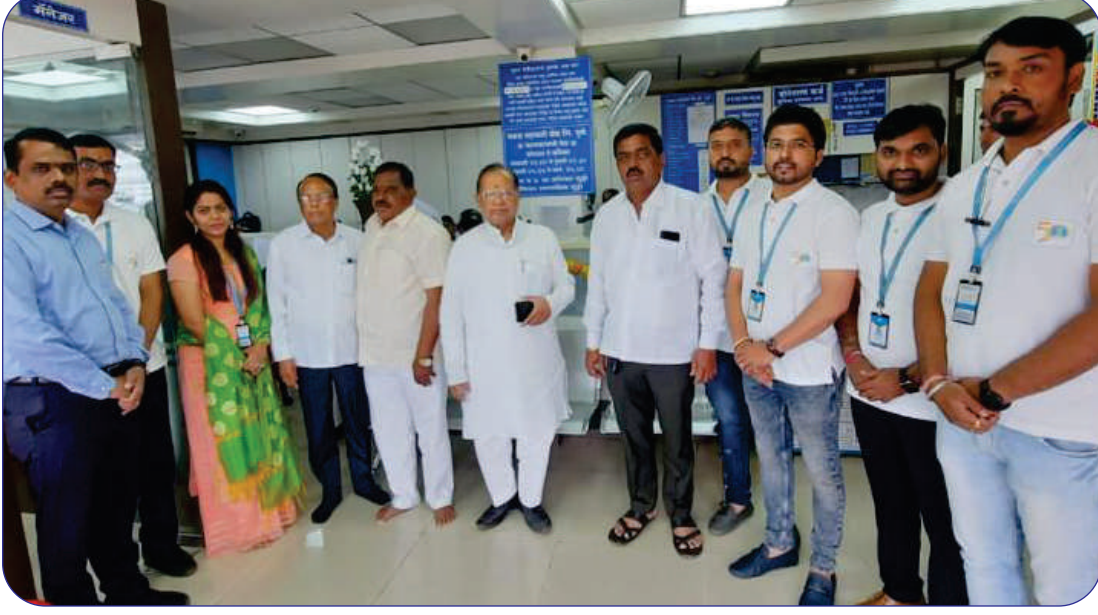
बँकेच्या स्पार्इन रोड शाखेच्या वर्धापन दिनी आरोग्य शिबीरात उपस्थित संचालक मंडळ व कर्मचारी