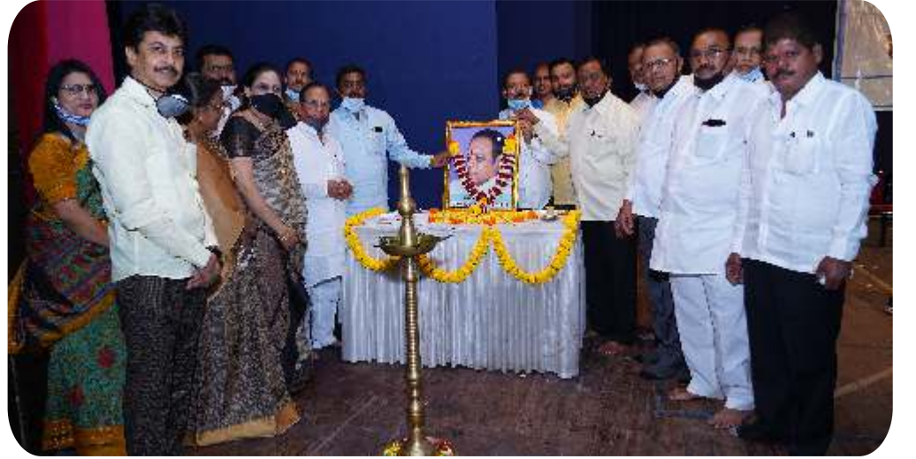
बँकेच्या ४७ व्या वार्षिक सर्वसाधारण सभेप्रसंगी उपस्थित मा. संचालक मंडळ