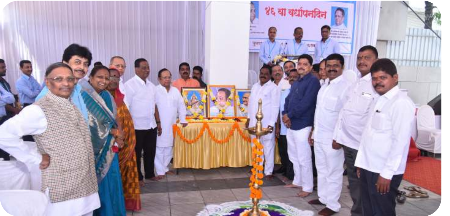
बँकेच्या ४६ व्या वर्धापनदिनी दिपप्रज्वलित करताना मा. संचालक मंडळ