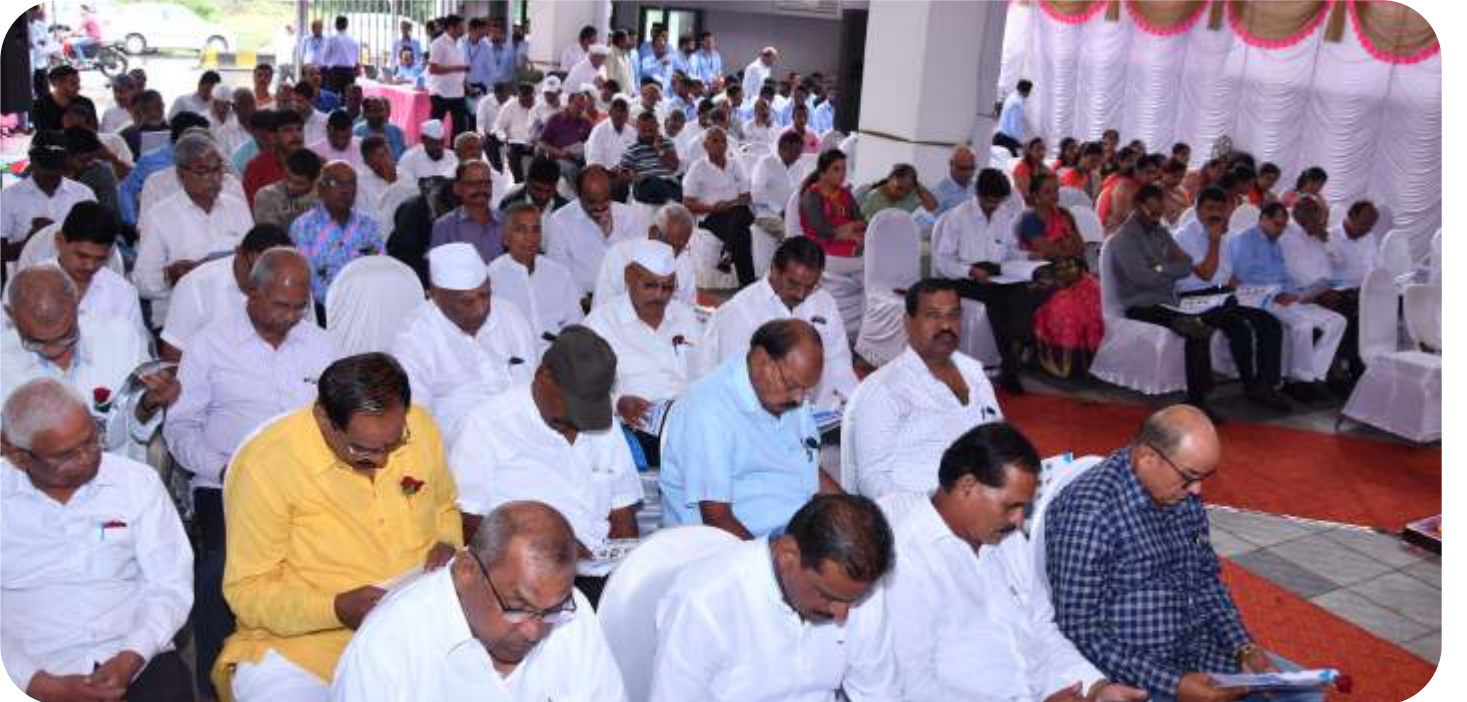
बँकेच्या ४६ व्या वार्षिक सर्वसाधारण सभेप्रसंगी उपस्थित सभासद