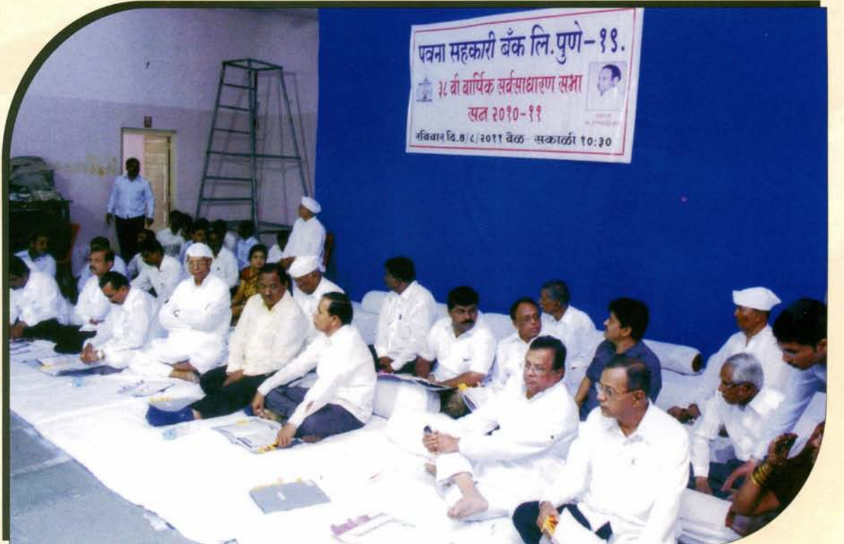
बँकेच्या ३८ व्या वार्षिक सर्वसाधारण सभेस उपस्थित मान्यवर